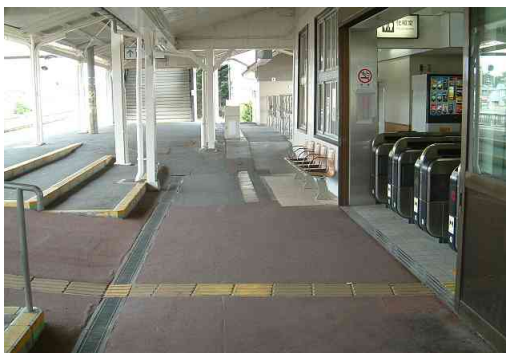
駅とホームの段差50cmを解消します