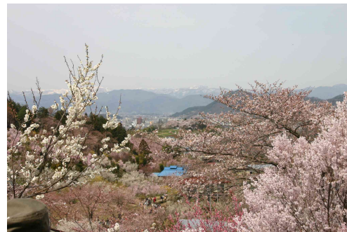
【花見山・イメージ】

桜などの春の花々が咲く花見山公園へのアクセス列車として 臨時列車を仙台～福島間で運転します。