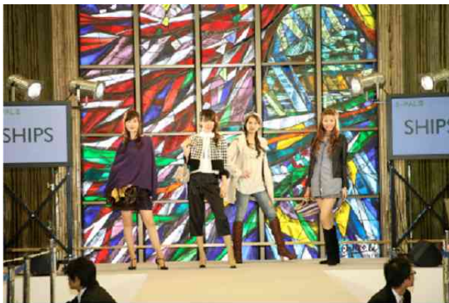
ファッション&トークショーイメージ